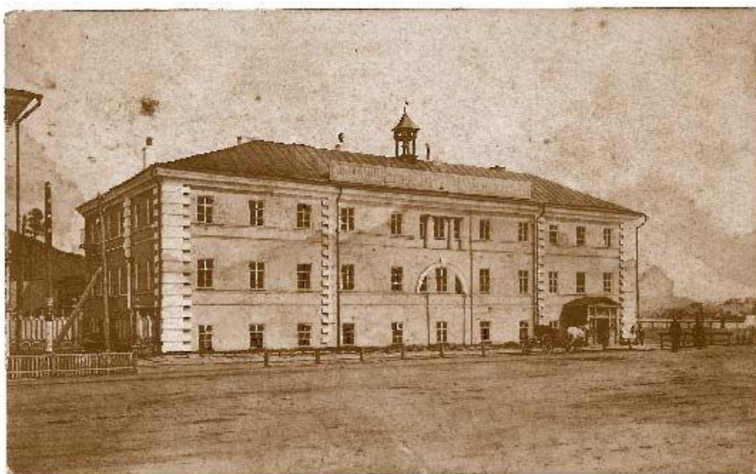
Златоуст. Управление горным округом. Фото конца XIX – начала XX века

Таким образом, еще при подготовке решения об организации казенного округа определено ему было стать оружейным арсеналом страны. Оружие и снаряды должны были производиться на головном Златоустовском заводе и Оружейной фабрике при нем. Остальные заводы должны были выделять качественный металл для него и других военных заводов страны. В состав округа, помимо Златоустовского «головного» завода, вошли Кусинский, Саткинский, Артинский заводы; позднее, в 1815 году, к ним присоединится и Миасский завод.