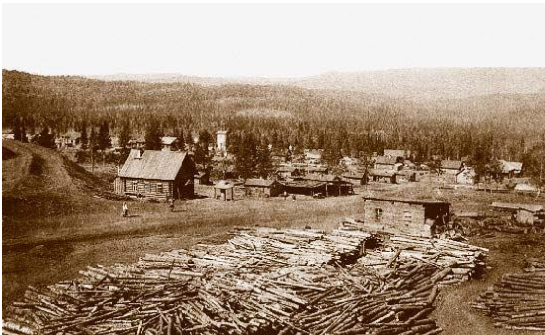
Бакал. Общий вид рудника и станции. Фото конца XIX – начала XX века

Артинский завод славился косами. «Горный журнал» за 1838 год писал в статье «О сравнительном испытании иностранных и Златоустовских кос»: «В 1836–1837 гг. в Удельном Земледельческом училище были испытаны косы, произведенные на Шафгаузенских заводах Фишера (Германия) и Златоустовских заводах из литой стали, штирийские и английские косы из сырой стали. Испытания показали, что Златоустовские косы острее и не уступают иностранным... Златоустовская коса выдержала два покоса и две ржавые жатвы».